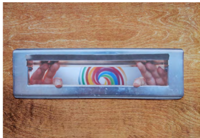
(VOORBEELD FOTO UIT VAN DEN BERGH & DIEMEL, 2021)

Deelnemers kunnen hun omgeving (thuis, werk of studie) in beeld brengen rondom een vooraf ingebracht vraagstuk of thema, bijvoorbeeld ervaren diversiteit en inclusie (Van den Bergh & Diemel, 2021). Omdat de methode via de foto's een levensecht inblikje geeft in de wereld van de deelnemers is het ook een schikt middel om in te zetten met bijvoorbeeld kinderen en jongeren, of mensen met een verminderde taalvaardigheid.